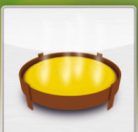
Оборудована чашкой для сбора жира