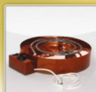
Возможность использования от электросети