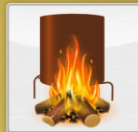
Использование без электричества