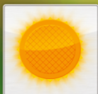
Индикатор включения нагрева